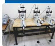
電腦控制自動計讀壓密試驗儀