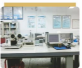
先進材料與技術發展實驗室