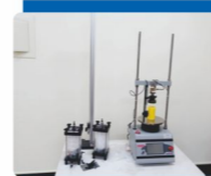
電腦控制自動計讀單軸試驗儀