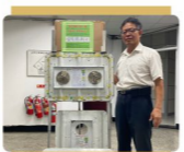
消防輔助滅火窗推廣暨全國安裝查詢中心