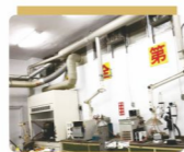
營建材料檢驗研究中心